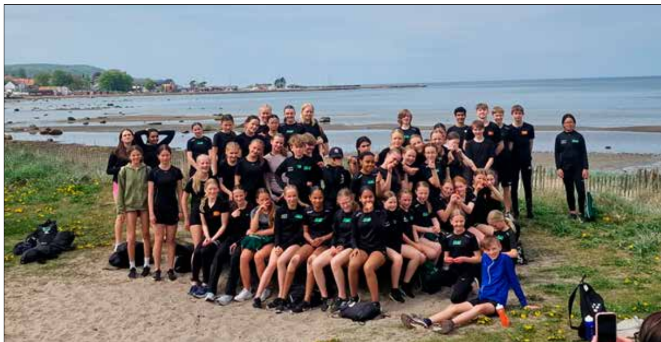
Båstadsläger, ungdomar födda 2009 - 2012

2024 bjöd också på tävlingar och det är inte utan stolthet vi ser hur våra aktiva hänger med nya kompisar från andra klubbar. Att få nya vänner och att utmana sig själv och se sin egen utveckling är många gånger viktigare än resultaten. Vi gläds och är stolta över den bredd vi har, men också över bra prestationer och att vi har aktiva som fightas i toppen av statistiken i olika grenar.