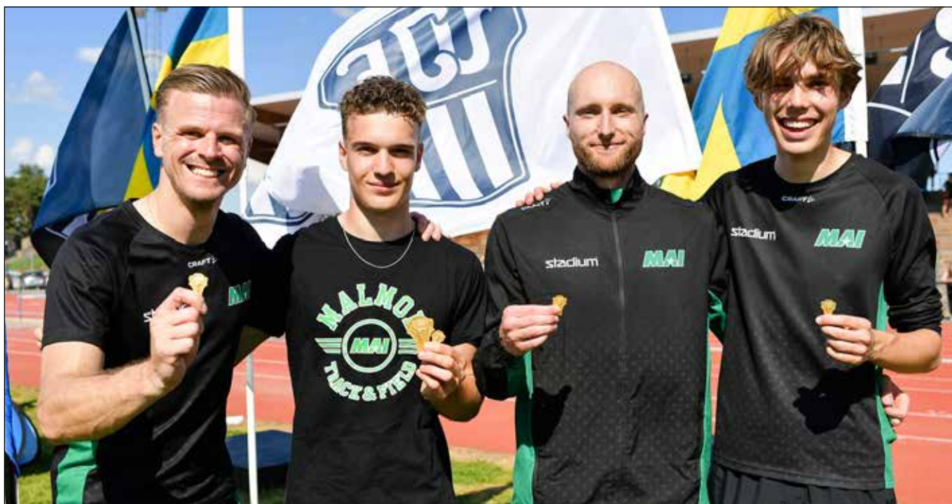
Guldvinnare på M 4x400 meter vid Stafett-SM.